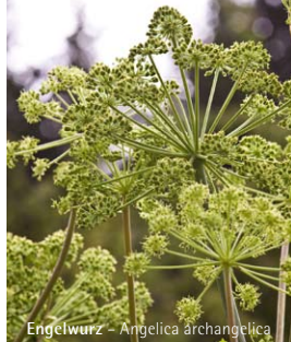
Engelwurz – Angelica archangelica

Schnupfen begleitet fast jede Erkältung. Ausgewählte Arzneimittelkompositionen regulieren die Flüssigkeitsprozesse im Kopfbereich. Festsitzender Schleim in der Nase fließt ab. Präparate mit Berberitze ( Berberis vulgaris ) und Schlehenfrüchten ( Prunus spinosa ) kräftigen die Nasenschleimhaut und unterstützen eine freie Atmung. Achten Sie darauf, die empfindlichen Nasenschleimhäute von Säuglingen und Kleinkindern nur mit Arzneimitteln zu behandeln, die keine ätherischen Öle enthalten. Das gilt genauso bei chronischem Schnupfen oder langfristigem Gebrauch.