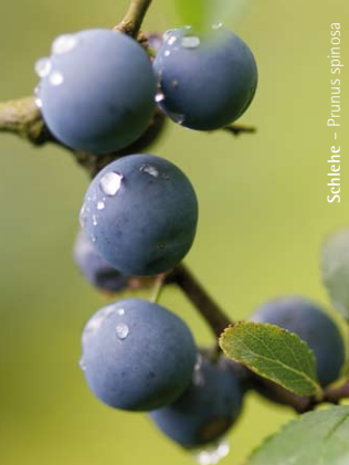
Slehe – Prunus spinosa