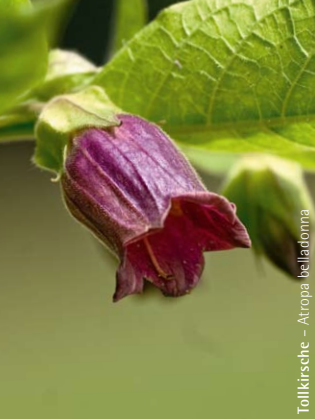
Tollkirsche – Atropa belladonna