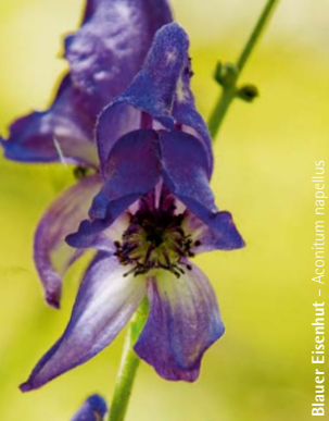
Blauer Eisenhut – Aconitum napellus