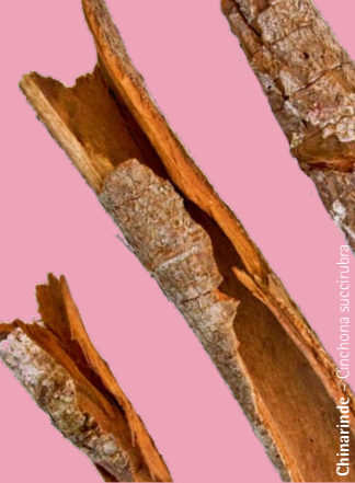
Chinarinde – Cinchona succirubra