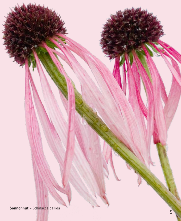
Sonnenuhr - Echinacea pallida