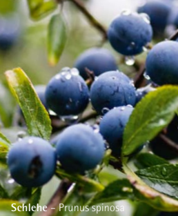
Schlehe – Prunus spinosa