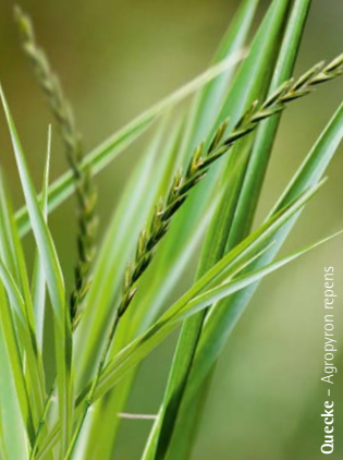
Quelle – Agropyron repens