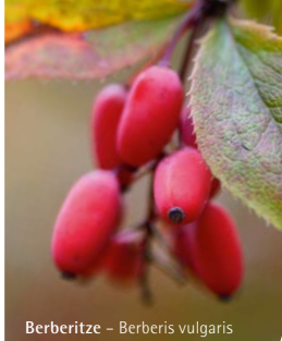
Berberitze – Berberis vulgaris